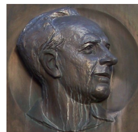
Obrázek 1 – Přemysl Pitter – bysta (autor: ŠJů, Wikimedia Commons)